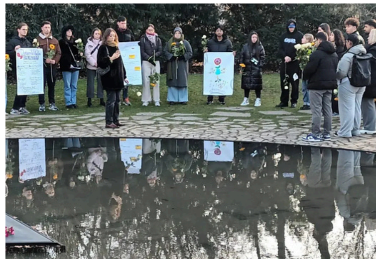
Erasmus+ KA153 Training Course - Roma Remembrance and Solidarity Annual Seminar 8-15 December 2025, Berlin /Germany

Notre organisation membre, Amaro Drom e.V., a organisé un séminaire cofinancé par le programme Erasmus+, visant à explorer les pratiques et les méthodes permettant d'impliquer et de responsabiliser les jeunes au sein des organisations de jeunesse afin de lutter contre la discrimination, le racisme, la xénophobie, et en particulier l'antitsiganisme. Il vise également à contribuer au développement d'une mémoire collective du souvenir et de la commémoration en sensibilisant davantage à l'Holocauste et au génocide des Roms pendant la Seconde Guerre mondiale. Trois participants français ont eu l'occasion d'y prendre part. Le projet a aidé les participants à développer une approche globale de la mémoire et de la commémoration du génocide en approfondissant leurs connaissances sur l'histoire des Roms, le génocide et l'antitsiganisme. Au cours du projet, les participants ont eu l'occasion de visiter le mémorial de Saxe et le mémorial de Ravensbrück, puis d'assister à la commémoration des jeunes au mémorial dédié aux Sinti et aux Roms d'Europe assassinés sous le nazisme.